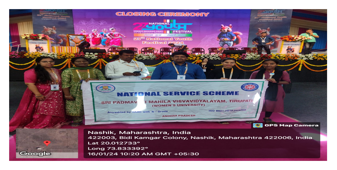
National Youth Festival at Nasik-2024