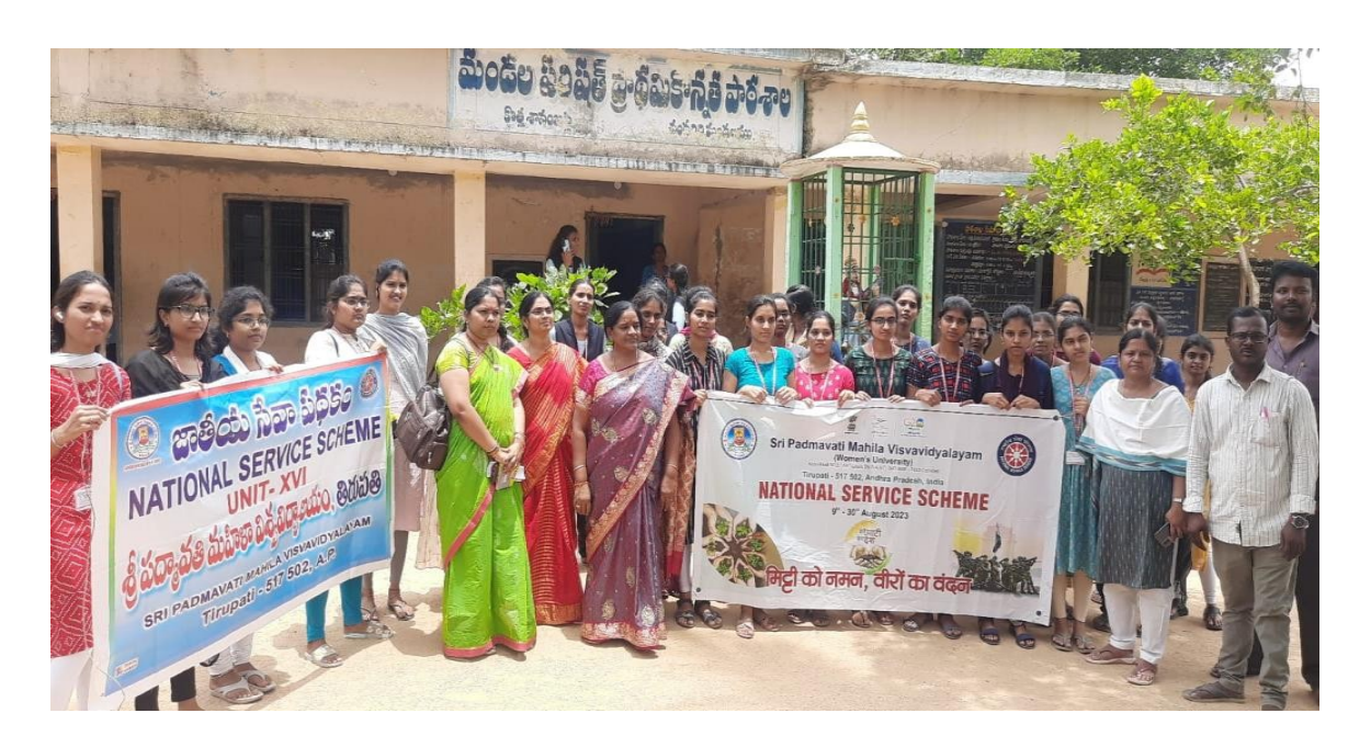
At adopted village