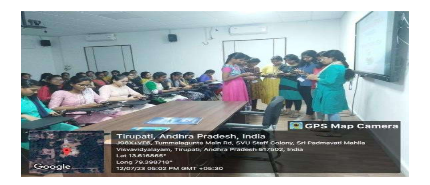
My Bharath portal Mass registrations