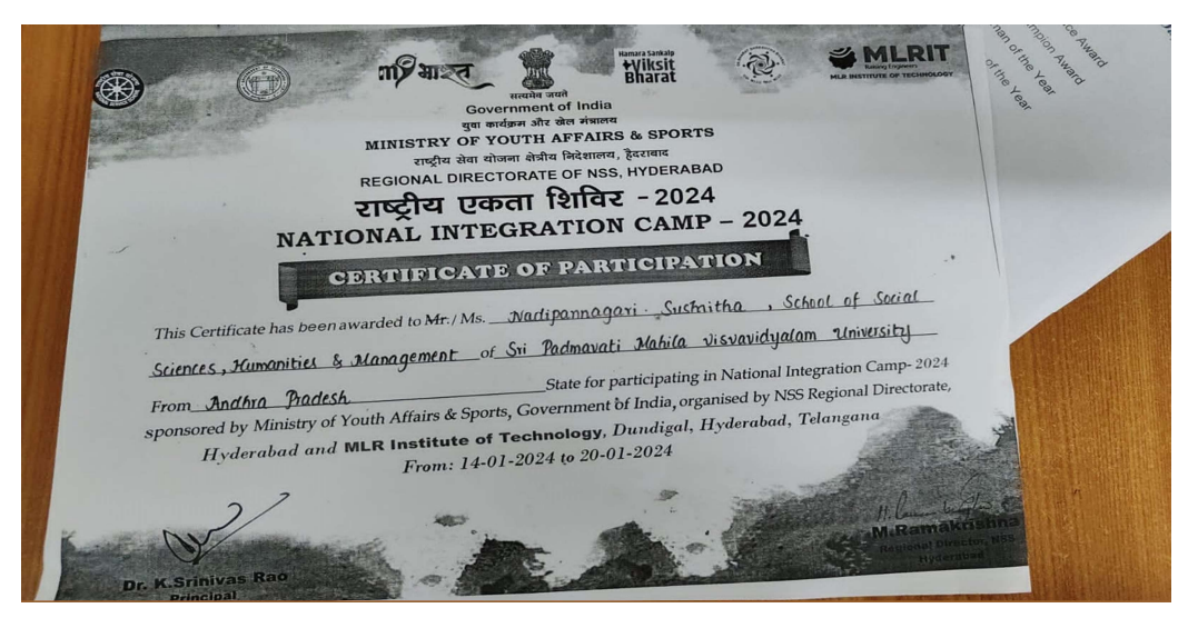
National Integration camp at Hyderabad