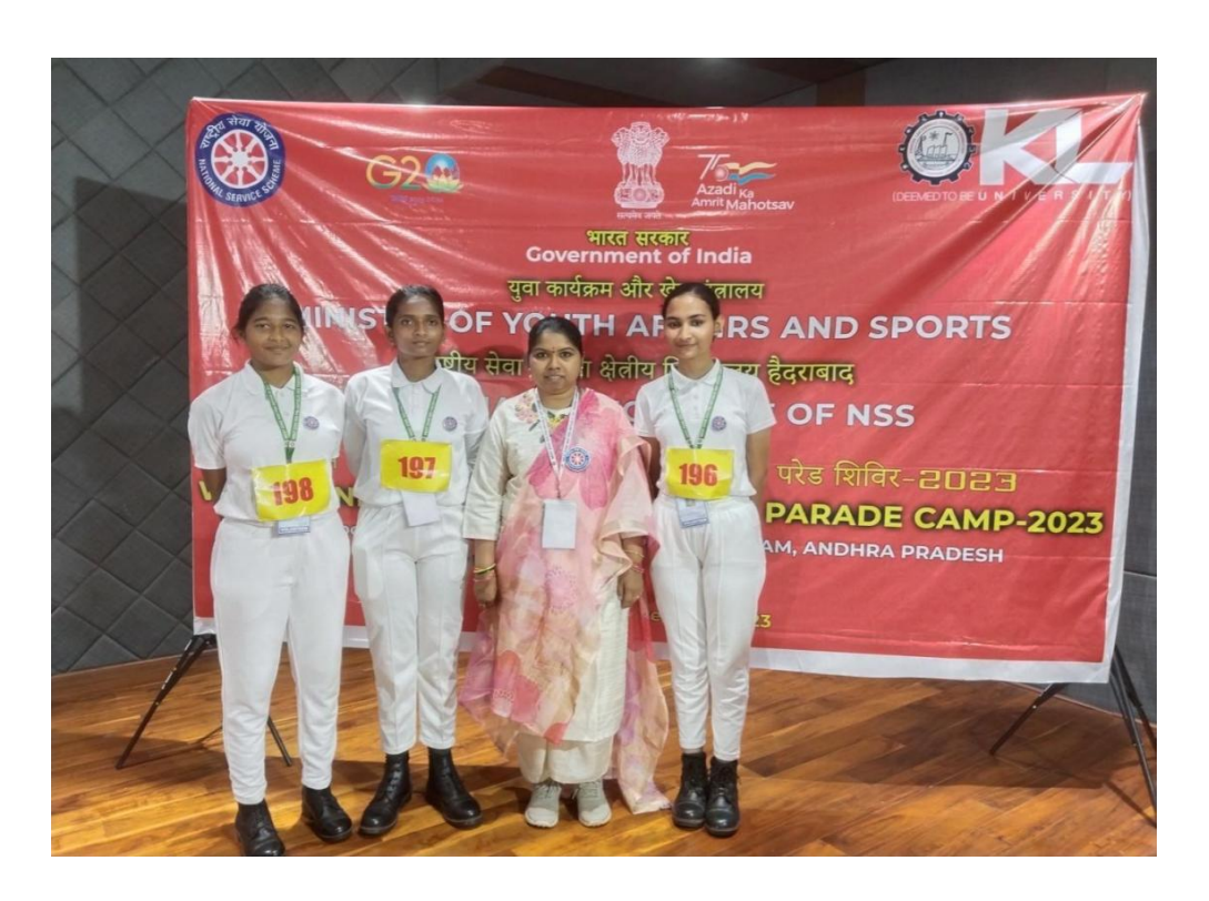
Pre RD camp at Vijayawada-2023