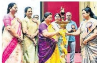
సభలో పాల్గొన్న వీసీ ప్రసన్నశ్రీ